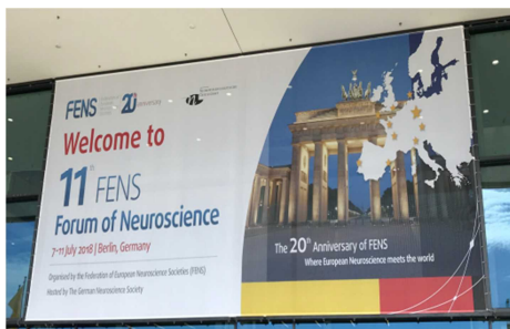
写真 1 学会会場

次回の”12 th FENS Forum of Neuroscience” は 2020 年に Glasgow, UK で開催です。